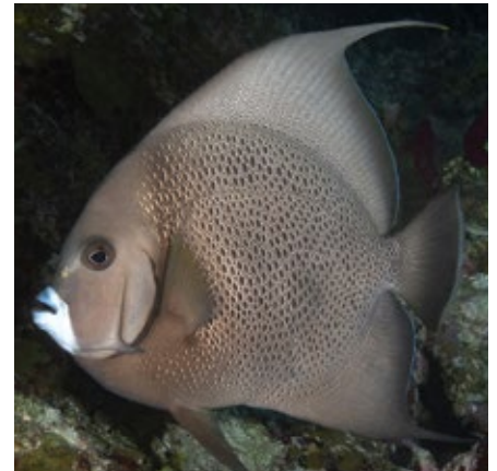
grijze keizersvis, Pomacanthus arcuatus, Belize