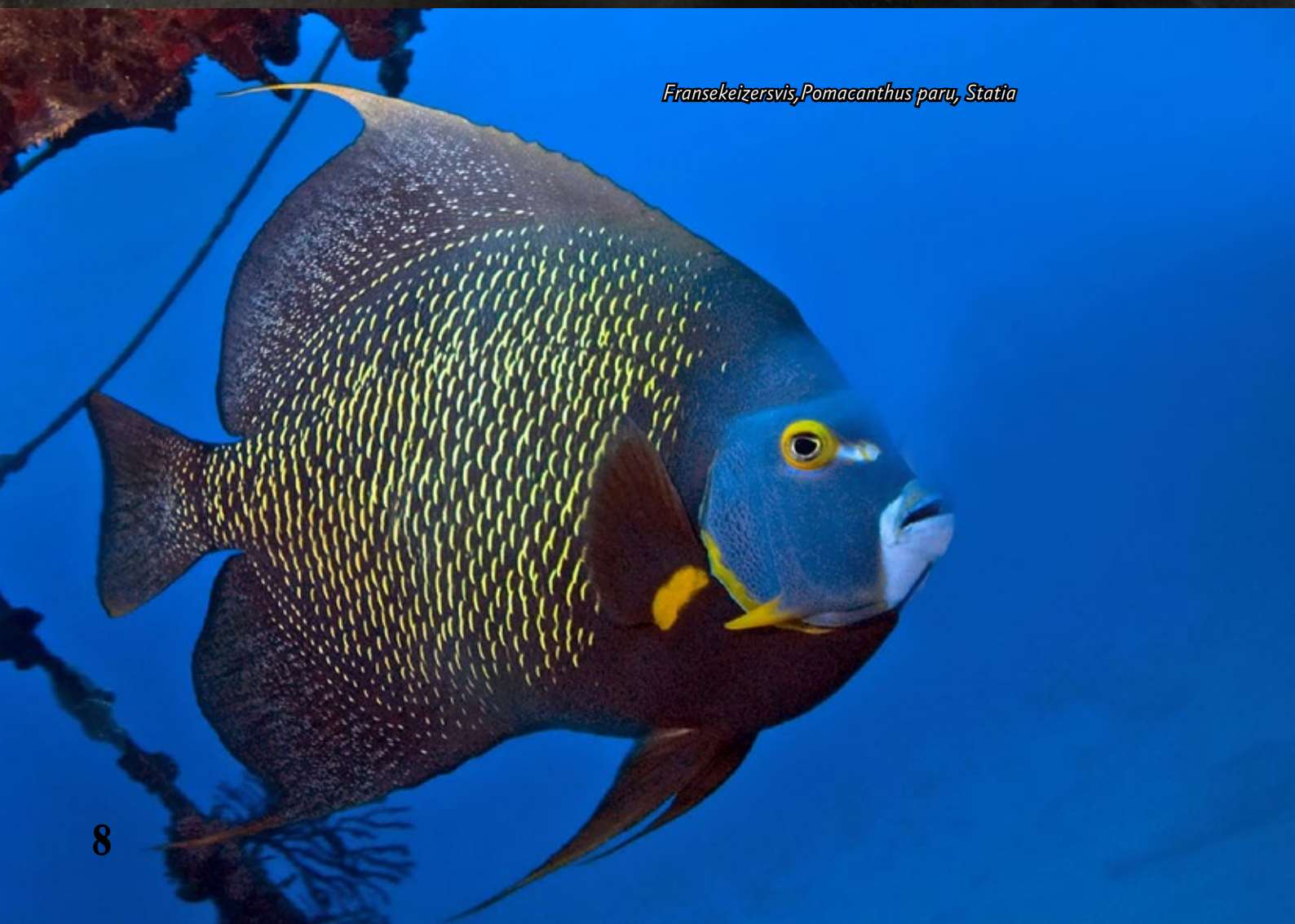
Fransekeizersvis, Pomacanthus paru, Stafia