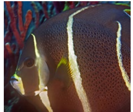
grijze keizersvis, Pomacanthus arcuatus, intermediate, Stata

Kan een lengte van 60 cm bereiken en is daarmee de grootste keizersvissoort. Hij wordt gevonden van New York tot Rio de Janeiro en dus ook in de golf van Mexico en het Caraïbisch gebied. Ze hebben een grijze kleur met zwarte stippen, de kop is effen grijs met een witte bek. De jongen zijn zwart met gele verticale strepen. Het is een schuwe vis en ondanks het grote verspreidingsgebied, moeilijk op de foto te krijgen. Ik ben ook reuze trots op mijn foto van de 'intermediate', de teenager. Hij was best wel groot, maar had toch nog de 'baby' strepen. Ze leven op een diepte van 3 tot 30 meter. De juvenielen zijn vaak ondiep te vinden tussen stukjes koraal en in zeegras bedden. Ze zijn overdag actief en schuilen 's nachts in het rif. Ze eten voornamelijk sponzen, maar ook wel algen, zakpijpen en hydroid poliepen. De voortplanting is in de zomer, van april tot september.