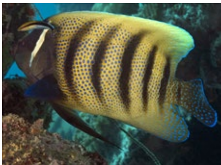
zesbandkeizersvis, Pomacanthus sexstriatus Komodo019