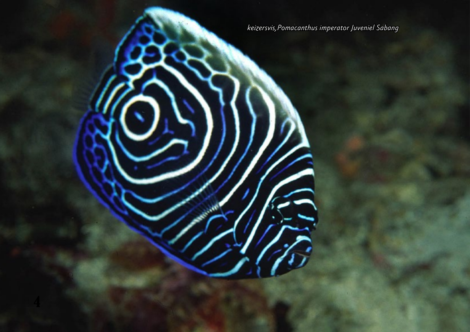
keizersvis, Pomacanthus imperator Juvenil Sabang