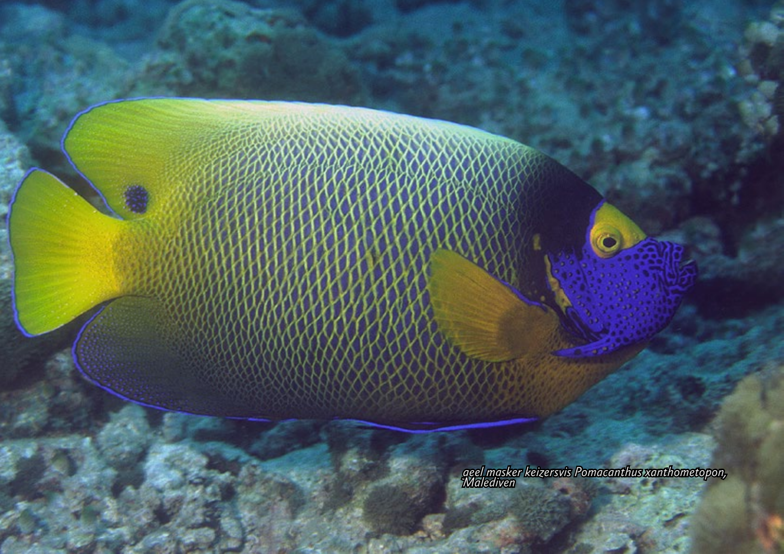
geel masker keizersvis Pomacanthus xanthometopon, Malediven