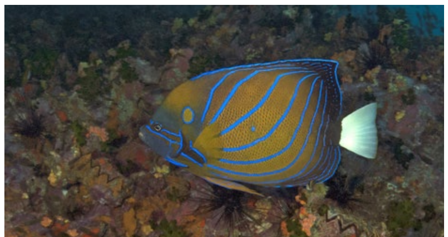
koningskeizervis, Pomacanthus annularis , Thailand

Deze soort wordt ook wel 'Blue-ringed-angelfish' genoemd, wat wel een mooie naam is met zijn fel blauwe ring en diagonale strepen op een gele achtergrond. Het jonge dier is donkerblauw met blauwe en witte strepen.