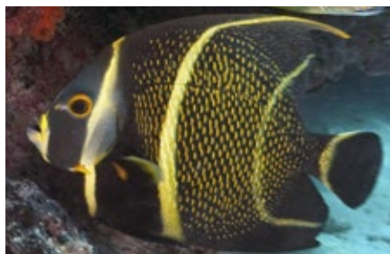
Franse keizersvis, Pomacanthus paru, intermediate, Curacao