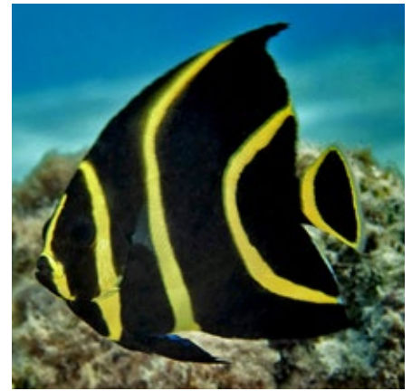
Franse keizersvis, Pomacanthus paru, juveniel, Curacao