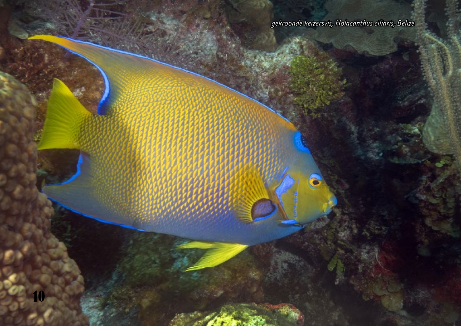
gekroonde keizersvis, Holacanthus ciliaris, Belize