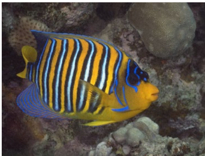
pauwoogkeizersvis, Pygoplites diacanthus , RodeZee

Deze kleuren hebben vermoedelijk ook een functie van camouflage. De blauwe plek op de staart (die op een oog lijkt) zou bijvoorbeeld mede kunnen dienen om belagers om de tuin te leiden. Jonge exemplaren hebben een afwijkende kleur, met een grote zwarte plek op het onderste deel van de zachte rugvin. Hij is klein en gedrongen van bouw, wel heeft hij een