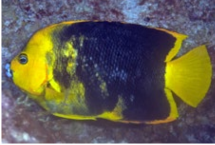
Hertogsvis, Rock Beauty, Holacanthus tricolor , Statia

Ze komen na 15 tot 20 uur uit in larven, die geen effectieve ogen, vinnen of zelfs darmen hebben.