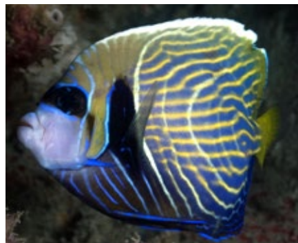
keizersvis, Pomacanthus imperator , intermediate, Raja Ampat