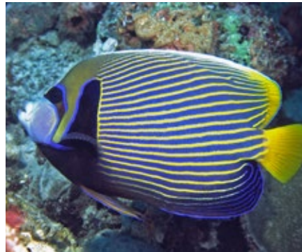
keizersvis, Pomacanthus imperator , Malediven

De meest bekende is wel de keizersvis, om verwarring te voorkomen wordt deze ook wel de 'gewone' keizersvis genoemd. Gewoon is hij zeker niet, het is wel een van de mooiste vissen die in de zee rondzwemt, ze kunnen tot 40 cm groot worden. Er wordt gezegd dat de mooie kleuren te maken hebben met hun territoriumgedrag. De jonge