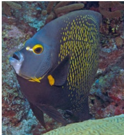
Franse keizersvis, Pomacanthus paru, Statia