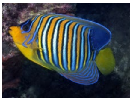
Pauwoog keizersvis, Pygoplites diacanthus , Pemba

Alle keizersvissen zijn mooi, maar de Pauwoog is de Parel van de Rode Zee. Het levensgebied strekt zich uit van de Rode Zee naar de Indische Oceaan en de Stille Oceaan. Dus van Madagaskar, Oost-Afrika, Malediven tot aan Japan. De kleuren zijn geel en blauw, mijn favoriete kleuren, met witte verticale strepen met zwart omlijnd. Die verschillende regionen kunnen soms kleine kleur nuances geven, het geel wat meer oranje, maar het knal gele staartje blijft altijd