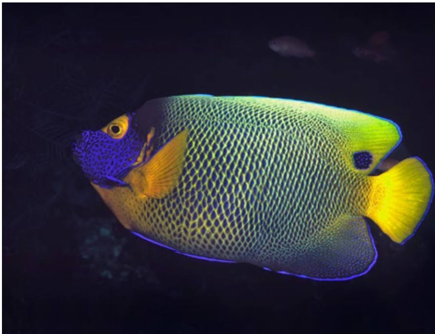
geel masker keizersvis, Pomacanthus xanhome-ton , Malediven

Deze mooie vis komt voor in de tropische wateren van Azië, vanaf de Malediven tot in de Stille Oceaan, het hele gebied wordt ook wel Indo-Pacific genoemd. De vis heeft prachtige gele en blauwe kleuren, daarom wordt hij ook wel blauwkop genoemd. Aan het einde van de rugvin zit een blauwe stip, zeer markant voor deze soort. Hij komt voor op tropische riffen, baaien en grotten op een diepte van 5 tot 30