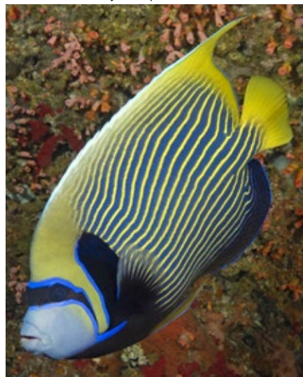
keizersvis, Pomacanthus imperator , Cebu

dieren, (juvenielen), zijn totaal anders van kleur, ze hebben een mix van blauwe en witte strepen, die een cirkel vormen. En als 'jong' volwassene; (intermediate), hebben ze een mix van de kleur van de juveniele en het volwassen dier, dus twee patronen, door elkaar heen (tot 5 cm). Het opmerkelijke kleurenpatroon heeft te maken met veilig kunnen betreden van het gebied van de volwassen dieren, die kunnen dreigen met onder andere klop geluiden.