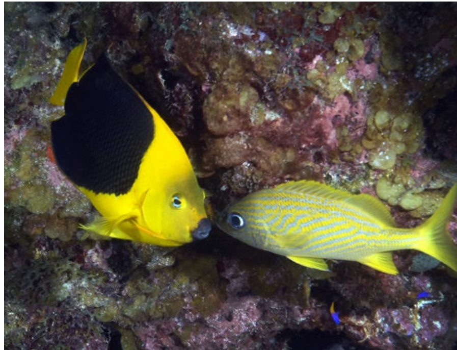
Hertogsvis, Rock Beauty, Holacanthus tricolor , Belize

Het ondergaat een enorme kleurverandering door van 'jong' naar volwassene. In de aquariumhandel zijn het geliefde soorten, vooral de kleintjes, want de grote kunnen agressief zijn tegen de eigen soort. Verder zijn ze makkelijk te houden en ze eten alles. In de natuur leeft hij op kustriffen met spaarzame koraal groei en in rotsachtige gebieden met veel schuilplaatsen. Hij kan wel 45 cm groot worden en komt voor van 3 tot 35 meter. De volwassen dieren zijn vaak paarsgewijs te vinden in spleten, holen of wrakken.