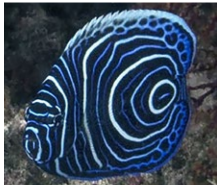
keizersvis, Pomacanthus imperator , juveniel, Oman