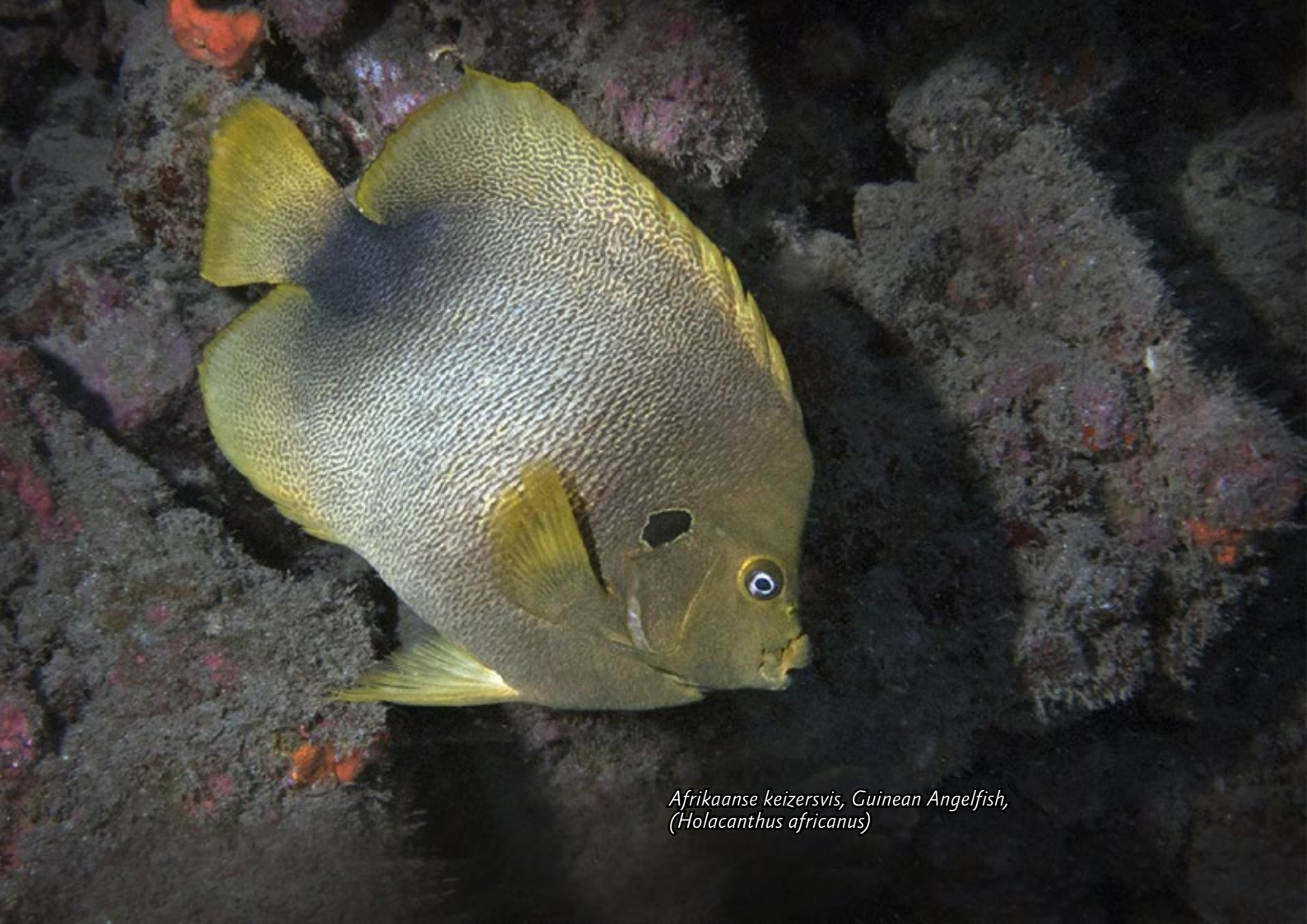
Afrikaanse keizersvis, Guinean Angelfish, (Holacanthus africanus)