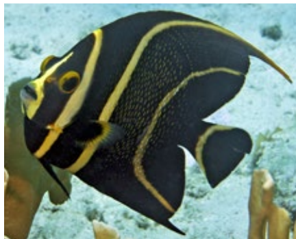
Franse keizersvis, Pomacanthus paru, intermediate, Curacao