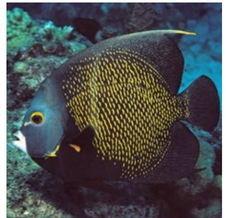
Franse keizersvis, Pomacanthus paru, Curacao

De Franse keizersvis is een grote keizersvis, hij komt voor in het westelijk deel van de Atlantische Oceaan, van Florida tot de Bahama's en Brazilië. De vis kan tot 40 centimeter groot worden, en heeft een plat lichaam met puntige uitlopers aan de rug- en aarsvin. De kleur is zwartachtig met goudomrande schubben op het lichaam (behalve de kin en borst) met een gele stip op de borstvinnen, om het oog is een gele rand.