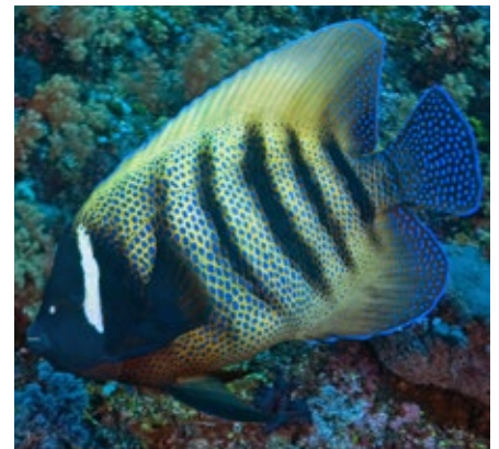
zesbandkeizersvis, Pomacanthus sexstratus , Komodo

koraalrijke lagunen en steile buitenrif wanden met een diepte van 1 tot 50 meter. Ze zijn zowel in helder als in troebel water te vinden.