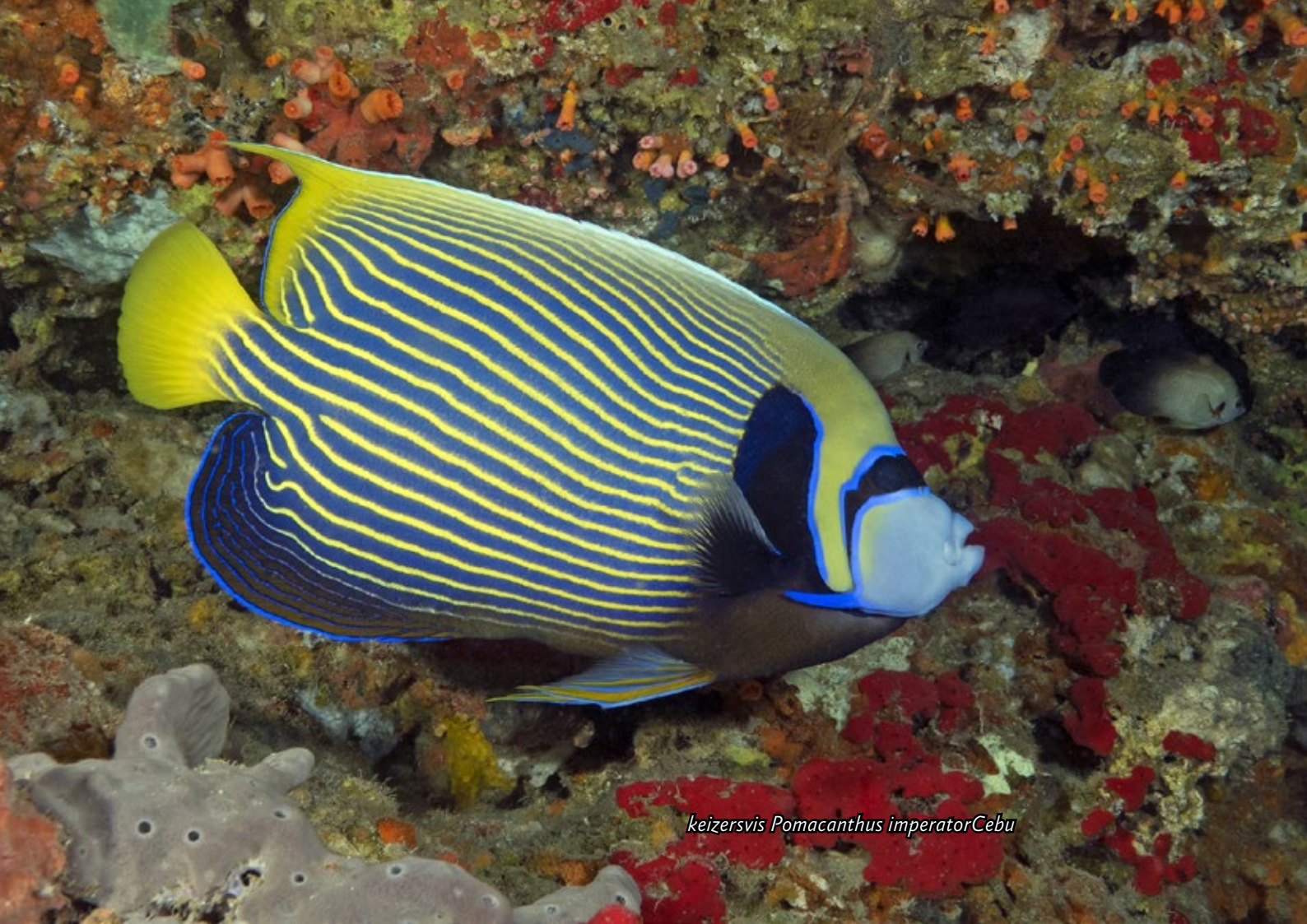
keizersvis Pomacanthus imperator Cebu