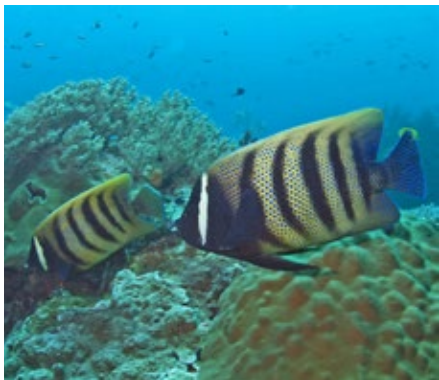
zesbandkeizersvis, Pomacanthus sexstriatus , Komodo

Het lichaam is ook nog eens bedekt met blauwe stippen en heeft blauwe randen, geweldig! Hun verspreidingsgebied is erg groot, van de Malediven tot Japan en Australië, ook wel de Indo-Pacific genoemd en ze kunnen wel 46 cm worden.