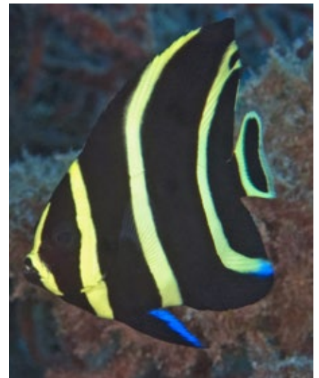
Franse keizersvis, Pomacanthus paru, juveniel, Statia