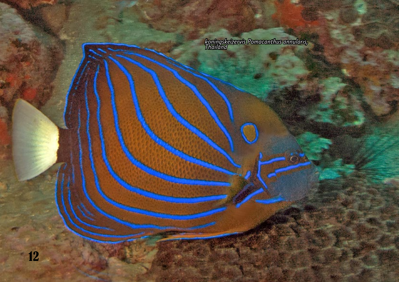
koningskeizervis Pomacanthus annularis, Thailand