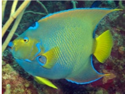
gekroonde keizersvis, Queen Angelfish, Holacanthus ciliaris, Stata

Deze prachtige vis heet niet voor niets de Koningin van de Keizersvissen, helemaal in geel en blauw en met