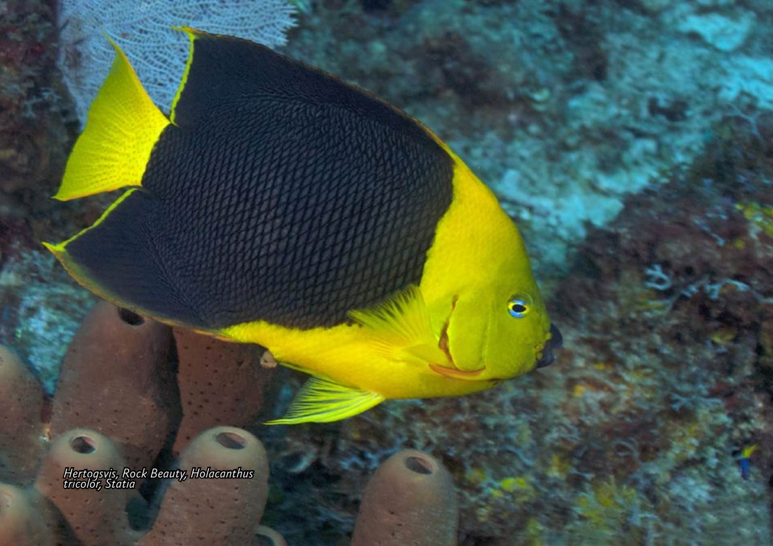
Hertogsvij, Rock Beauty, Holacanthus tricolor, Statia